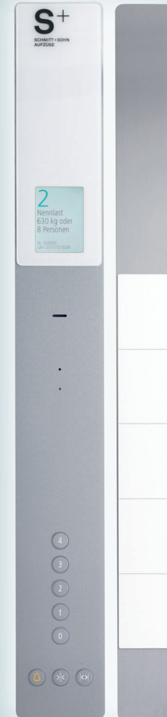
Schmitt + Sohn Aufzüge bieten Innovation und Perfektion in jedem Detail.