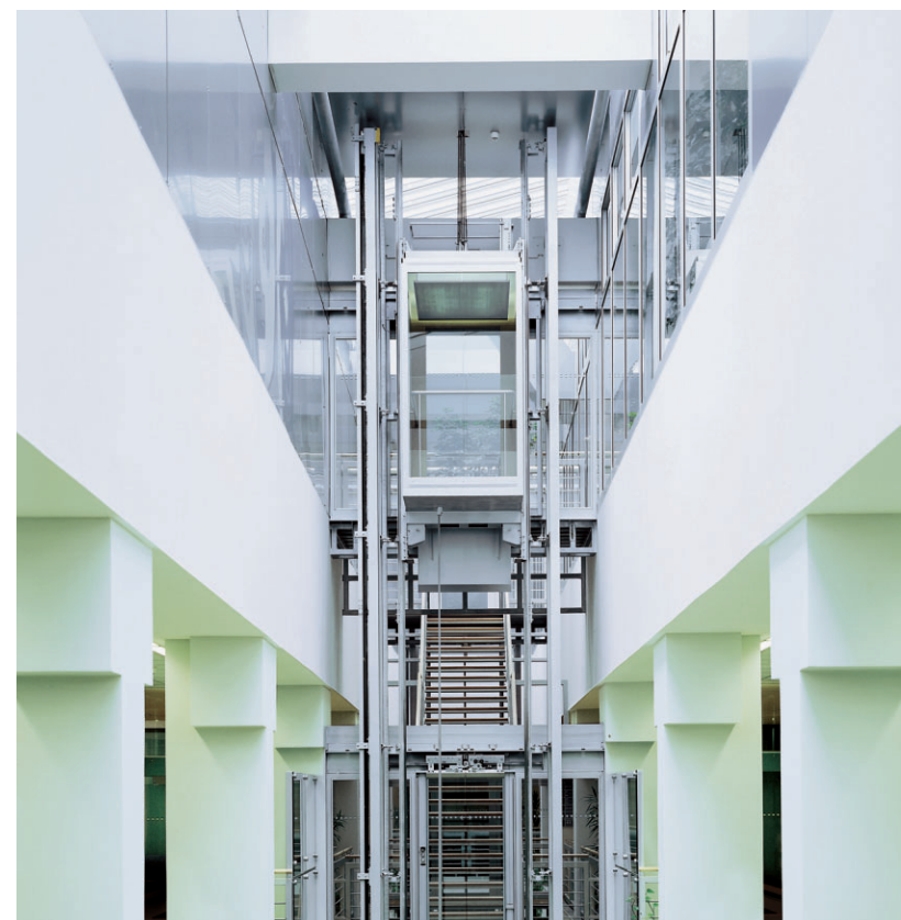
Architektur Design Technik im überzeugenden Dialog